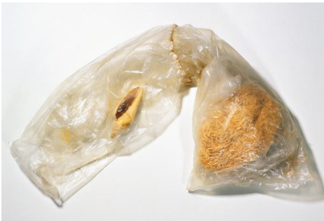
Figura 2 – Saco plástico com conchas e serragem (1976).