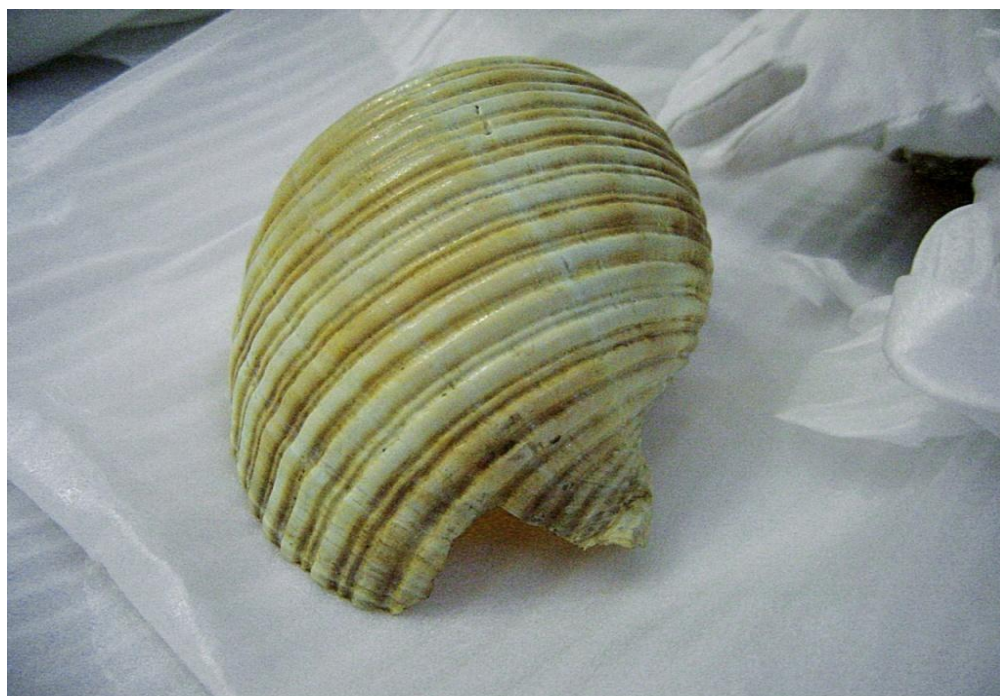
Figura 4 – Conchas (1976).