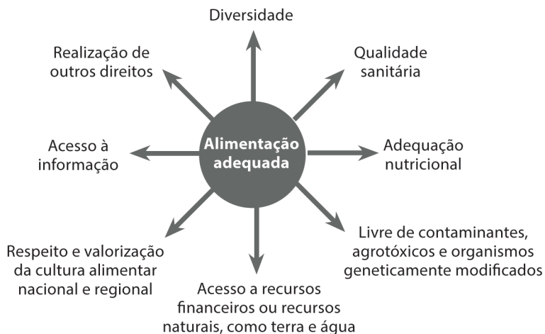
Figura 2 - Alimentação adequada e a multiplicidade de fatores

Importante pontuar a pluralidade de fatores essenciais à alimentação adequada, bem expressa pela figura abaixo (LEÃO, 2013, p.30):