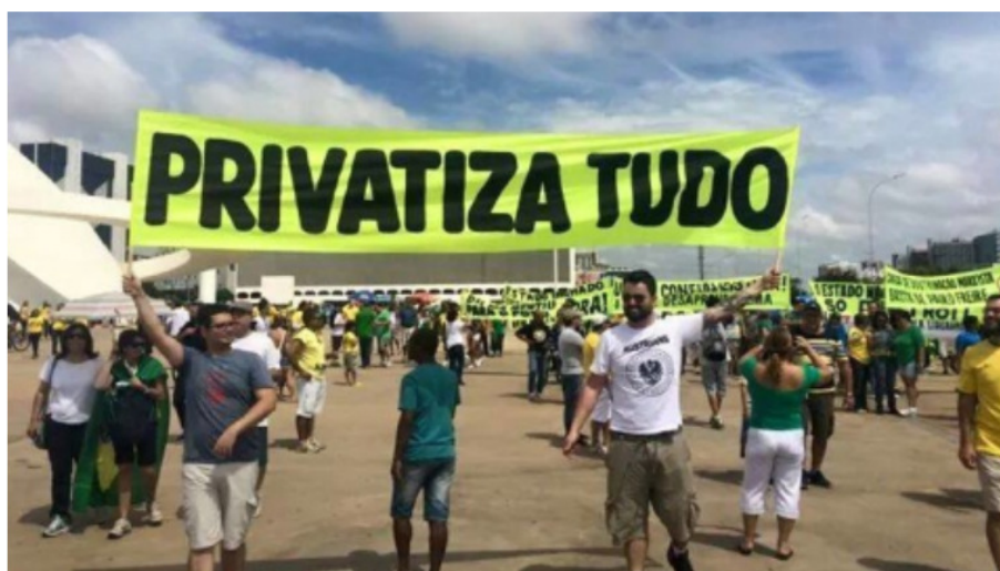
Figura 2 – Recurso visual introdutório

No que diz respeito ao gênero ora em escrutínio, além da maneira pela qual ele é estruturado para atingir os seus propósitos comunicativos, importa chamar atenção, inicialmente, para a imagem que acompanha, num fito de apresentação, a organização textual: