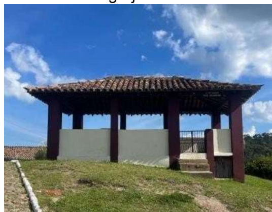
Figura 2 - Vista do Coreto da Igreja Matriz de Conceição do Ibitipoca (MG).

A presença de coretos em espaços públicos suscita reflexões sobre sua função original e sua permanência ao longo do tempo, sobretudo diante da ausência de programas musicais específicos para esses locais (NUNES, 2012). O abandono dessas estruturas revela uma realidade preocupante: a falta de uso compromete sua conservação e reduz o potencial turístico e recreativo das áreas em que se inserem. No entanto, quando preservados e requalificados, os coretos podem se tornar importantes atrativos culturais e de lazer, enriquecendo a experiência de moradores e visitantes (SOUZA JUNIOR, 2025). Alguns municípios têm promovido ações de revitalização, convertendo esses espaços em locais para eventos e atividades comunitárias, como ocorre com o coreto situado em frente à Igreja Matriz Nossa Senhora da Conceição, em Conceição do Ibitipoca, distrito de Lima Duarte (MG) (Figura 2).