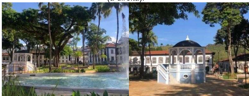
Figura 9 - Vista geral da Praça Gomes Freire (à esquerda) e detalhe do coreto (à direita).

A partir dos pontos de vista acima, é percebido que os coretos e praças requalificados possuem grande potencial como atrativos turísticos e de lazer. Quando restaurados e reativados, esses espaços culturais atraem moradores e visitantes interessados em história local, apresentações artísticas e culturais e na atmosfera desses locais. A Praça Gomes Freire, localizada na cidade de Mariana (MG), conhecida como "Jardim de Mariana" (Figura 9), exemplifica esse uso. Foi observado em campo que a referida praça conta com um coreto, um lago artificial e uma fonte do século XVIII, ladeados por casarões coloniais, sendo frequentemente utilizada para eventos, apresentações musicais e atividades recreativas pela comunidade local.