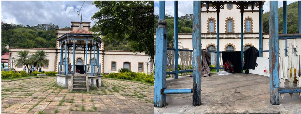
Figura 4 - Vista do Coreto da Praça Cesário Alvim em Ouro Preto (à esquerda) e pertences de pessoas em situação de rua (à direita).

ou momentos de lazer. Esta situação levou à deterioração de sua estrutura, uso inadequado e abandono, conforme pode ser visto abaixo: