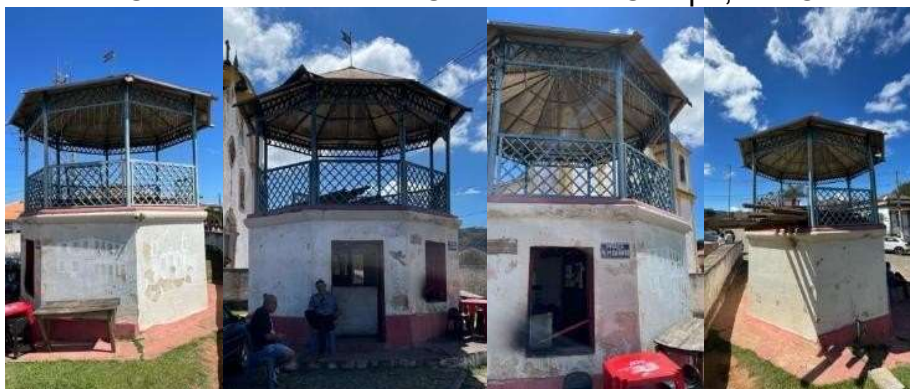
Figura 6 - Vistas do Coreto do distrito de Cachoeira do Campo, em Ouro Preto (MG).