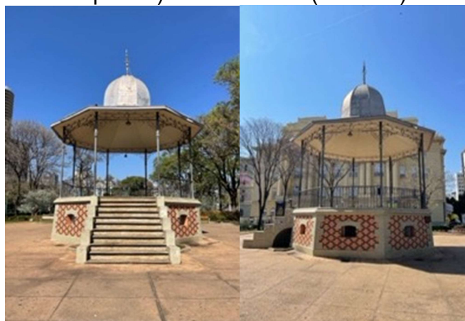
Figura 11 - Coreto da Praça da Liberdade em Belo Horizonte, vista frontal (à esquerda) e vista lateral (à direita).

Desde então, o coreto é ponto de encontro da população belo-orientina, usado para apresentações musicais, rodas de conversa, local para ensaios fotográficos, saraus, dentre outros.