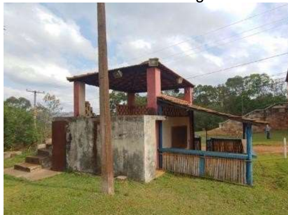
Figura 1 – Vista do Coreto do Distrito de Miguel Burnier em Ouro Preto (MG).