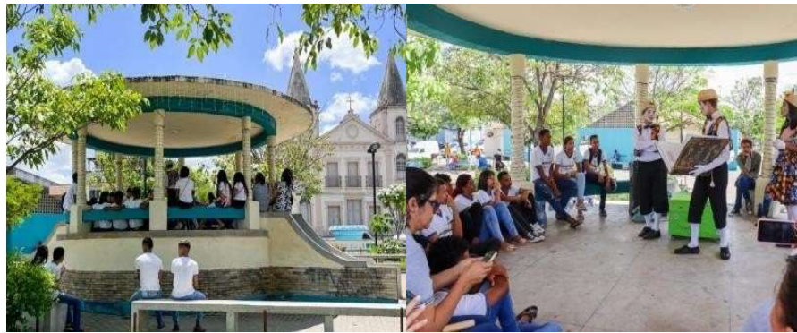
Figura 3 - Atividades culturais no Coreto de Vitória de Santo Antão (PE).