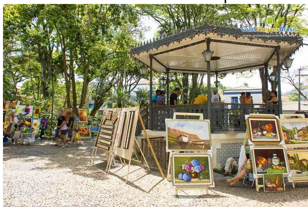
Figura 10 - Coreto de Embu das Artes utilizado para uma exposição de artes.