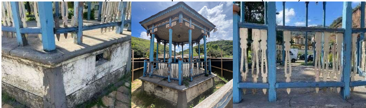
Figura 8 - Biofilme causado por microrganismos (à esquerda), diversas patologias (ao centro), e perda de suporte dos balaústres (à direita).

A cobertura do coreto necessita de manutenção. Apesar da aparente estabilidade estrutural, apresenta manchas escurecidas e perda parcial de suporte do material, indicando possíveis infiltrações que afetam o engradamento e o forro de lambri. O forro exibe pátinas biológicas decorrentes de teias de aracnídeos, enquanto o pináculo apresenta descoloração e perda da camada pictórica. Os ornamentos circulares próximos ao forro acumulam sujidades. Nas alvenarias, observam-se diversas patologias associadas à exposição prolongada às intempéries, como radiação solar e umidade, resultando em manchas biológicas, biofilmes de fungos, perdas de argamassa e pintura, trincas, fissuras, rachaduras e deterioração de elementos de madeira (Figura 8). Uma das esquadrias encontra-se descaracterizada em relação ao estilo original e apresenta oxidação generalizada.