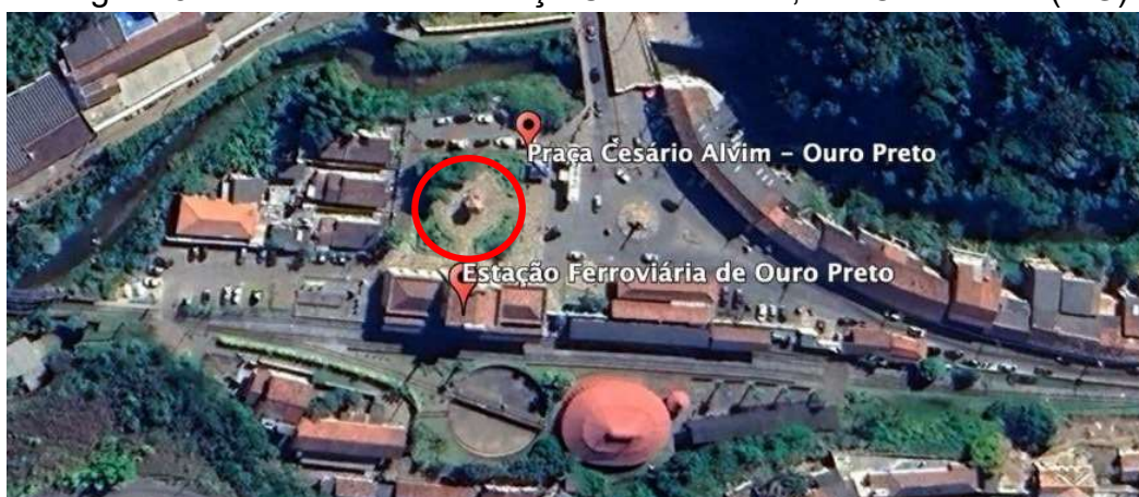
Figura 5 - Vista satélite da Praça Cesário Alvim, em Ouro Preto (MG).