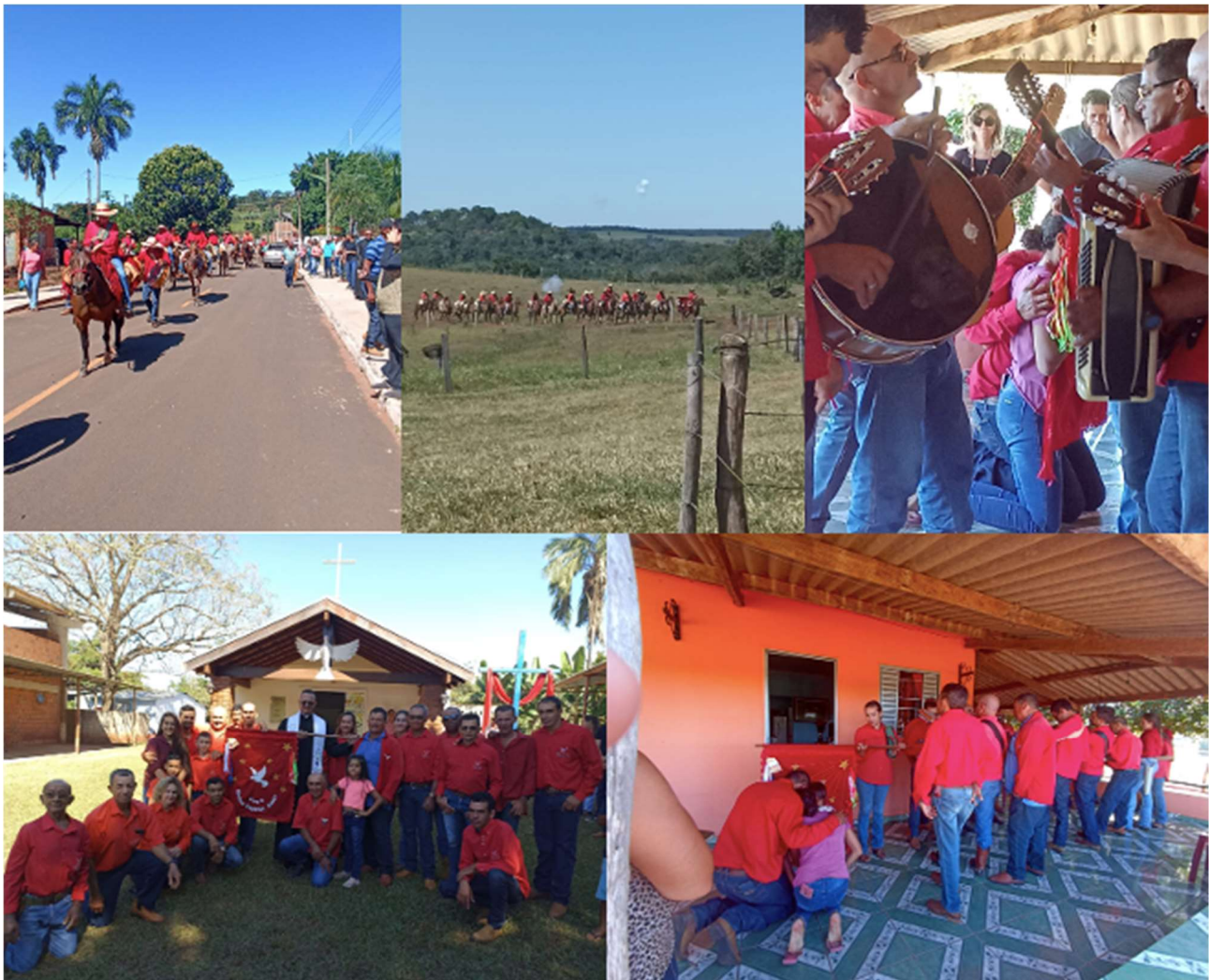
Figura 1 – Imagens da Festa

encerram todas as emoções do dia, onde extravasam essa mistura de sentimentos ritualizados, do sagrado ao profano. No domingo de pentecostes, acontece o sorteio das funções para a próxima edição da festa, onde iniciam os trabalhos, a partir de avaliações e ressalvas, no contexto dos objetivos a serem alcançados pela comunidade receptiva. Elaboração: Os autores (2023).