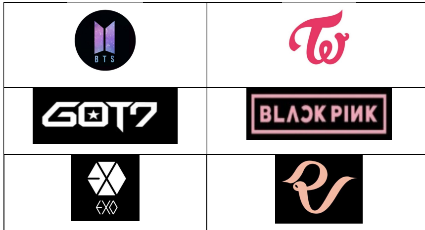
Figura 5: Logo de K-pop

O primeiro contato com a cultura coreana, na maioria dos casos, ocorre através do K-pop, podendo ser um boy group , como BTS , EXO ou GOT7 ou girl group como Black Pink , Twice ou Red Velvet . A figura 5 apresenta as logos desses grupos.