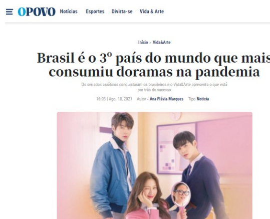
Figura 1: Notícia do consumo de doramas no Brasil