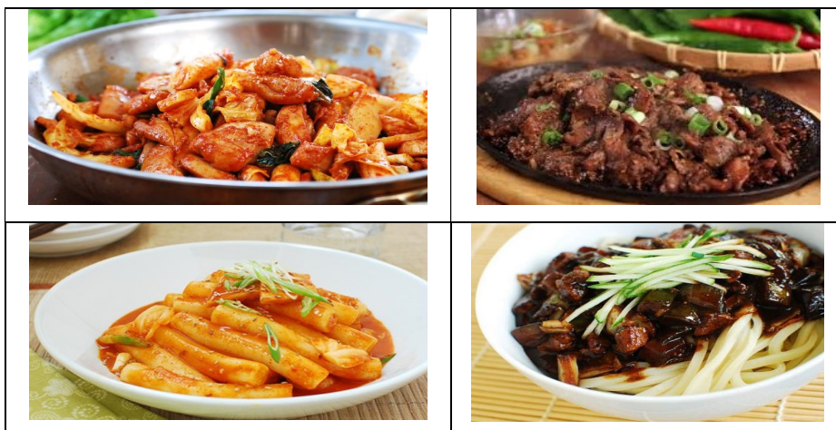
Figura 7: Comidas típicas coreanas