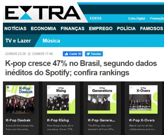
Figura 6: Crescimento do k-pop no Brasil

Fonte: Disponível em: < https://extra.globo.com/tv-e-lazer/musica/k-pop-cresce-47-no-brasil-segundo-dados-ineditos-do-spotify-confira-rankings-24655053.html >. Acesso em: 11 ago. 2021