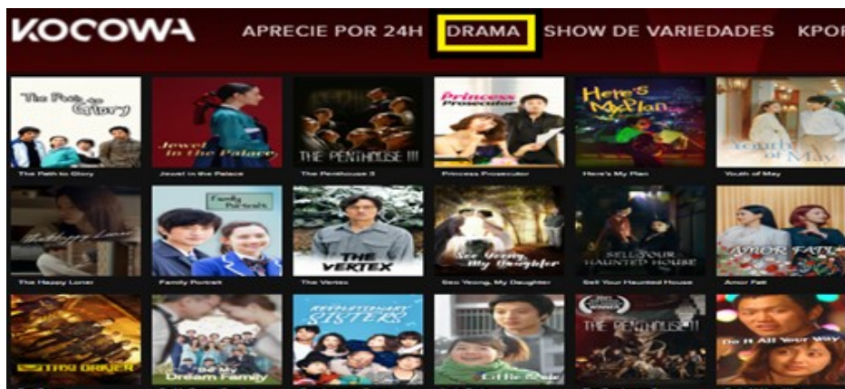
Figura 4: Plataforma Kocowa