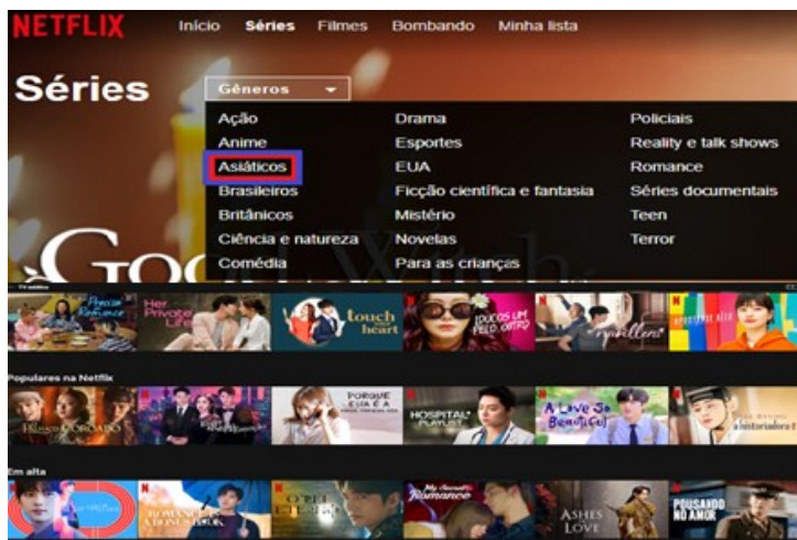
Figura 2: Plataforma Netflix