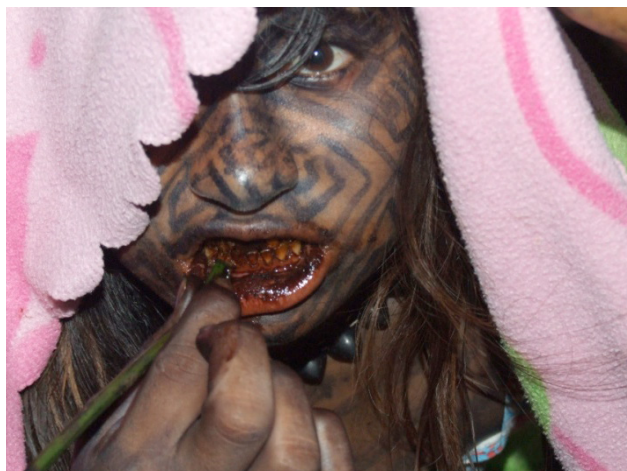
Figura 4 – Pintura dos dentes com o nixpu

Fonte: Marchese, 2012a, p. 321. Fotografia na Praia do Carapã, Aldeia Povo Junto no Futuro, outubro de 2009.